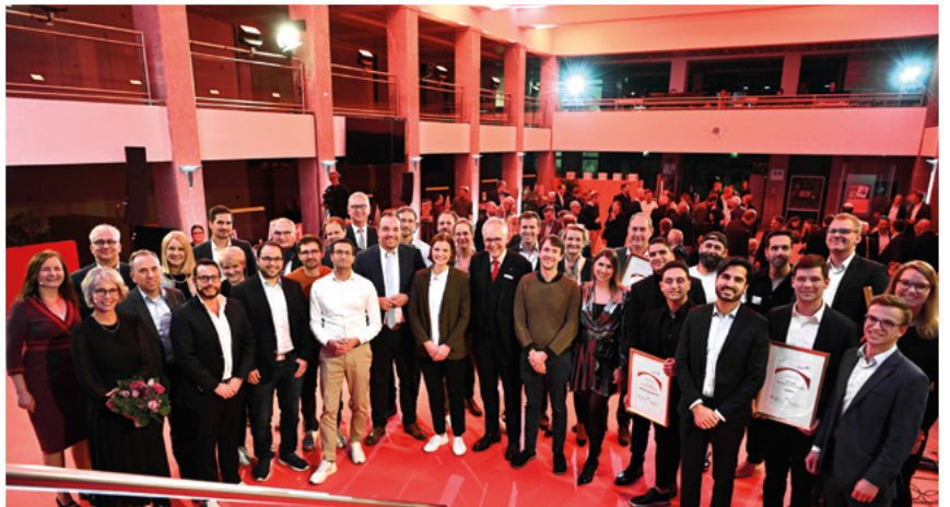
Preisträger und Juroren des Hessischen Gründerpreises 2022

Alle Infos und Anmeldung unter hessischer-gruenderpreis.de